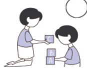
Partage avec un camarade