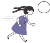
Court dans la classe