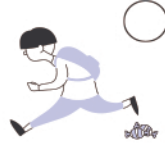
Jette les déchets dans la salle de cours