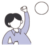
Lève la main

Parmi les enfants suivants, qui suit les règles de la classe ? Donne-leur des étoiles pour un travail bien fait.