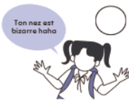
Se moque d'un camarade