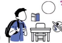
Prend soin du matériel collectif