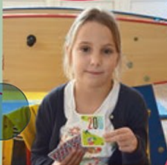
VICTOIRE 7 ANS