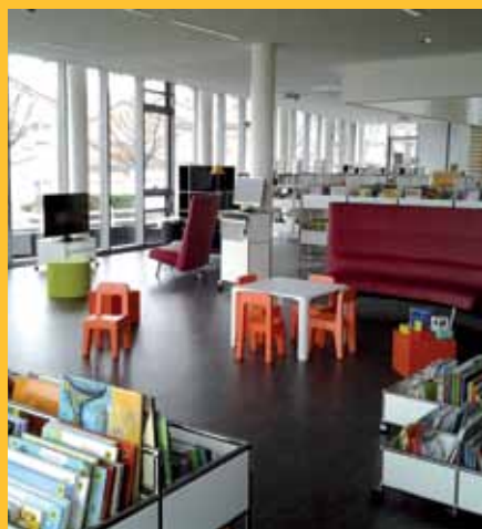
La médiathèque Aimé-Césaire va bientôt ouvrir ses portes au public.